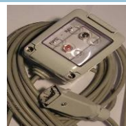
- filo controlli vari modelli