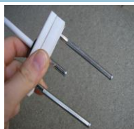
- sensore di livello