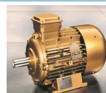
-Motore SuPreme IE5