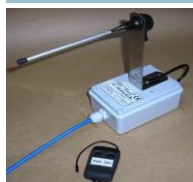
- optional radicontrollo