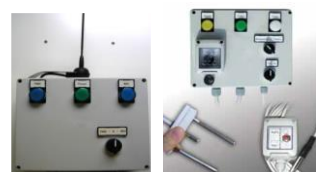
- Sensori ed automazione