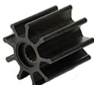
- giranti in neoprene