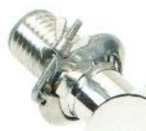
- raccorderia personalizzata